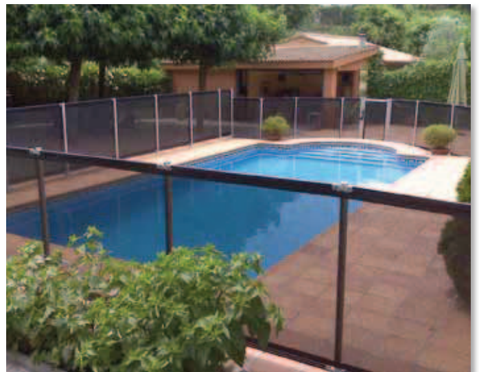
FLASH-N COLOR NEGRO