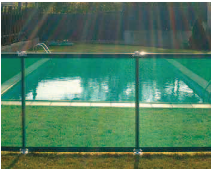
FLASH-N COLOR VERDE

Con una malla de Poliéster plastificada, opcionalmente en dos colores, permite una perfecta visión del espacio interior.